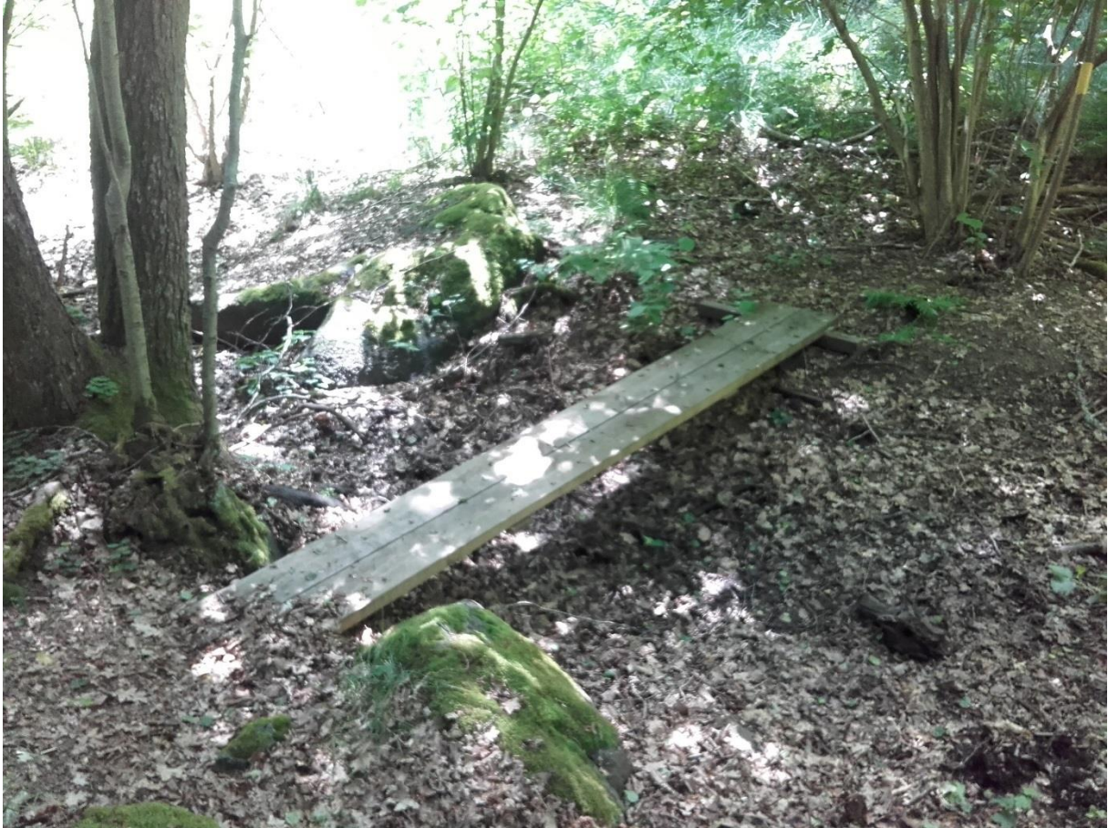
Enkel spång som byggts för att underlätta passage över dike.