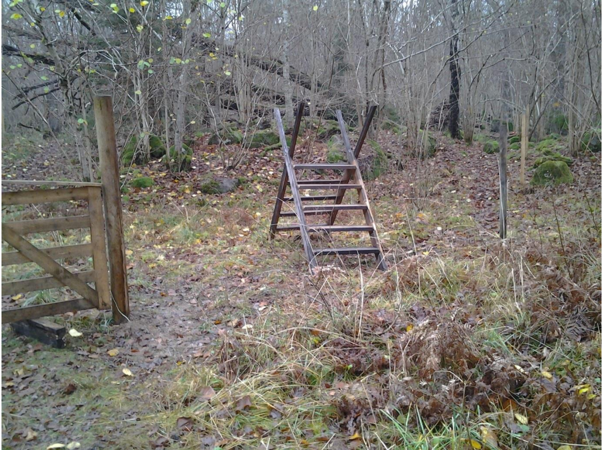
Stätta för att möjliggöra passage av stängsel utan att behöva öppna grinden. (Bilden tagen innan stängsel satts upp)