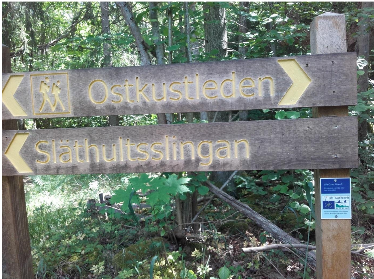
Skyltar i ek med fräst och målad text.