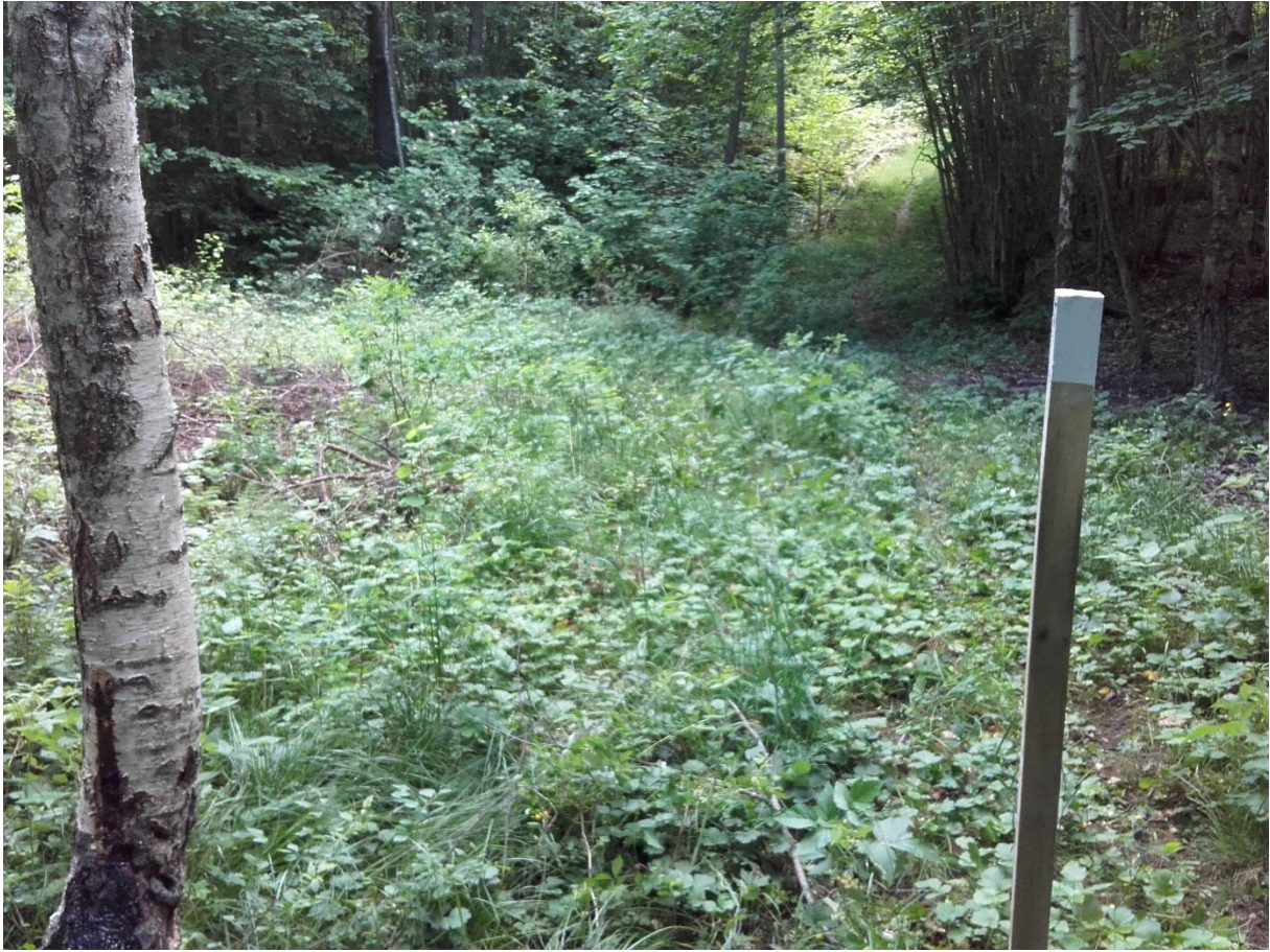
Leden är markerad med ekstolpar som målats i toppen. Slingan i reservatet har vit färg. De sträckor som ingår i Ostkustleden har gul färg.