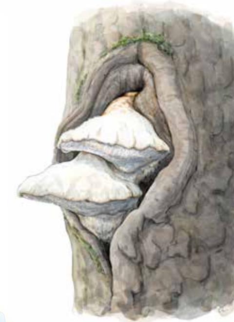
apelticka Spongipellis fissilis