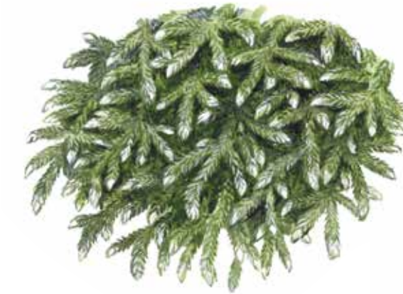
fällmossa Antitrichia curtipendula