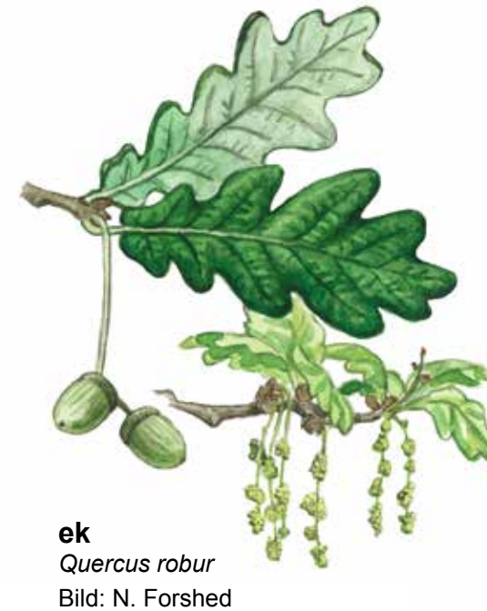
ek Quercus robur Bild: N. Forshed