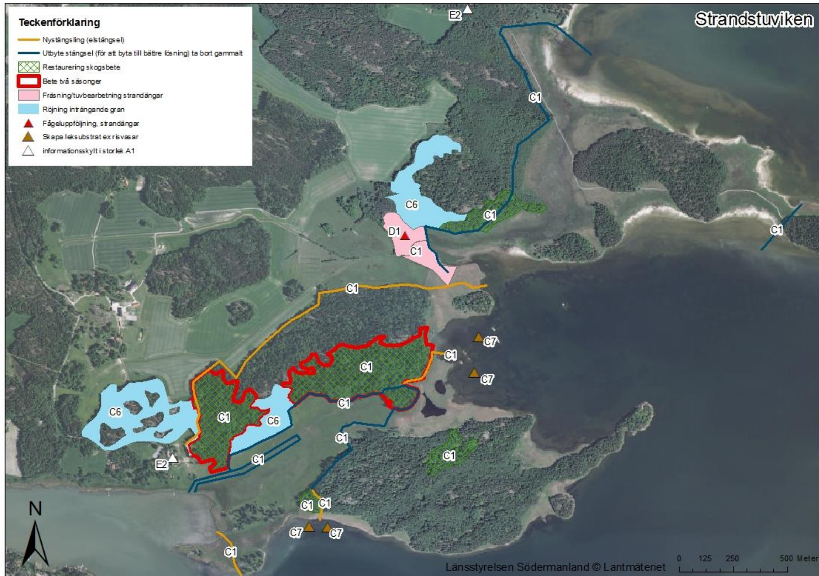
Bilaga 1. Karta över planerade åtgärder enligt ansökan.