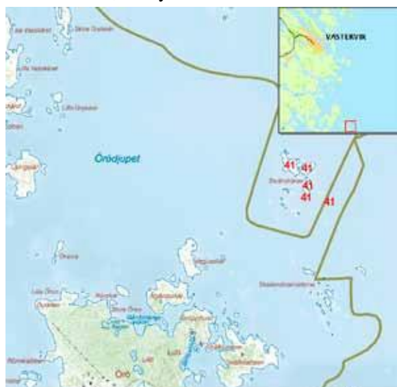
© Landinventering av Örogruppen Örogruppen, beståndskartan Öro 106/2004100 Skränskären. inventeringsområde nr 41.

ejder som påträffats häckande varje år, medan de arter som grågås, småskrake, strandskata, havstrut och skärpiplärka häckat sporadiskt. Under 90-talet häckade gravand, roskarl och fiskmåås i området. Kustlabb har häckat, förutom 1984, vid fyra tillfällen under 90-talet.