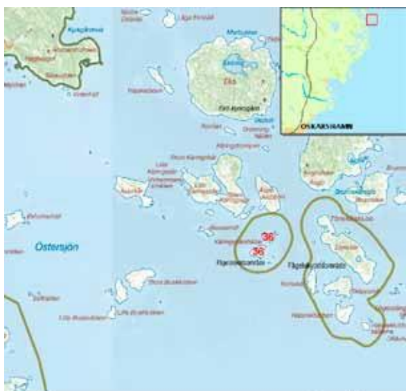
Käringskärshällar. inventeringsområde nr 36.

Kolonihäckare som skrattnås, fiskmås och silvertärna har resulterat i ett rikare fågelliv, främst under senare delen av 90-talet. Då har även arter som gräsand, skedand, skäggdopping, rödbena och drill- snäppa häckat i skydd av vitfågeln. Under många år häckade de flesta fåglarna på det nordligare skäret, men under de senaste inventeringssäsongerna har arterna påträffats alltmer på det sydligare skäret.