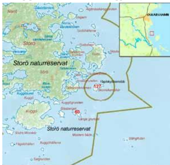
Ulf Bengtsson Örngeles, kartgränsvärden: DKR 105-2014/180 Skomakareskär. inventeringsområde nr 127.

Ornitologisk beskrivning: Inventeringen 1984 visade på en relativt rik fågelfauna, bl.a. gravand och kolonier med fiskmå, gråtrut och silvertärna, men sedan följde många år då skäret var öde. Plötsligt etablerades några mindre kolonier 2007, bl.a. skratmå, 9 par och silvertärna, 24 par. Under 2008 hade skratmåskolonin ökat till 45 par. Kolonierna förde i sin tur med sig att andra arter etablerade sig på skäret, bl.a. gravand, vigg, större strandpipare, rödbena och drillsnäppa.