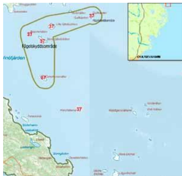
Östrehorvehällar med närliggande skär. inventeringsområde nr 37.

På Horvhällarna har silvertärna häckat med några par vissa år. På skären Stora och Lilla Gåsklubben och Gullklanten har fågellivet varit art- och individfattigt under inventeringsperioden. Enstaka par av knölsvan, grågås, ejder, strandskata, fiskmås och havstrut påträffas vissa år och vid några tillfällen har det etablerats en liten koloni med silvertärna på Stora Gåsklubben.