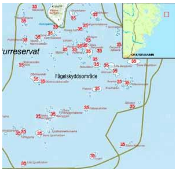
© Landbruksverket. Utgåva 2010. Översikt, redigering: Öv 106/20041101 Bosskärsarkipelagen, inventeringsområde nr 35.