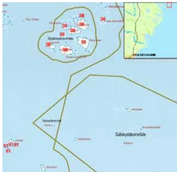
SF Orosgruppskartor, redigerat kartor. Önr. 106-2001100 Strupöarkipelagen. inventeringsområde nr 38.

Ö-gruppens betydelse för häckande kustfåglar var som störst i början av 90-talet, men efter hand har både arter och antal minskat betydligt. Idag finns inte några, eller endast enstaka par, kvar av arter som vigg, svärta, strandskata, rödbena, fiskmåås, gråtrut, havstrut eller skärpiplärka. Grågås och ejder hör till de arter man fortfarande träffar på i området. Gravand och skedand har häckat vid enstaka tillfällen.