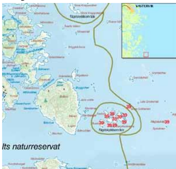
DL, landskapsinventering av Östergötlands Örnspår, bestandsinventering av Örnspår nr 39. Gårklubbarna. inventeringsområde nr 39.

Ornitologisk beskrivning: Liksom i flera andra områden var häckfågelfaunan som rikast under 90-talet för att successivt minska under 2000-talet. Idag saknas många av de häckfåglar som påträffades under 90-talet, bl.a. svärta, rödbena, drillsnäppa, roskarl och skrattnås. Av populationerna fiskmå, som mest 23 par, och gråtrut, som mest 48 par återstår endast ett fåtal par. Även populationen av ejder har minskat kraftigt i området.