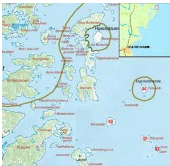
Öv. 106-200110 inventeringsområden Stångskär (32), dantaskär (33), fjöleskär (34).

Ornitologisk beskrivning: Under 90-talet var skäret hemvist för flera av karaktärsarterna i skärgården, men från 1999 och framåt har art- och individantalet minskat markant. En koloni med gråtrut, som mest 18 par, och en koloni med silvertärna, 12 par har dominerat fågellivet på skäret under senare år. Tidigare häckade roskarl på Fjöleskär.