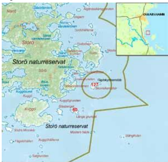
© Lantbruksverket. Ulf Bengtsson Örngeles, kartgränsvärden: DKR 105-2014/180 långa grundet. inventeringsområde nr 60.

Ornitologisk beskrivning: Vid inventeringen 1984 påträffades en relativt sparsam fågelfauna och efter flera års frånvaro etablerade sig åter kustfåglar på skäret 2003, då bl.a. skratmå, 8 par och silvertärna, 38 par häckade. Efter 2006 saknades många häckfåglar och vid inventeringen 2007 noterades endast fyra arter i ett fåtal exemplar. I skydd av den relativt stora kolonin med silvertärna häckade vidare som större strandpipare, rödbena och roskarl under några år.