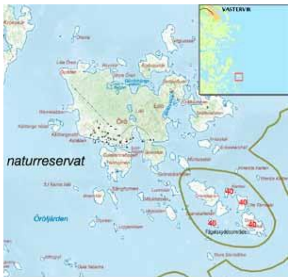
© Landinventering av Örogruppen Örogruppen, beståndskartan Öro 106/2004100 Stora och lilla tärnskär. inventeringsområde nr 40.