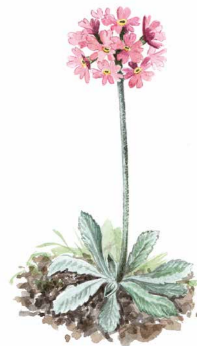
Majviva ( Primula farinosa ) blommar i maj-juni med röda eller blekvioletta blommor. Majvivan trivs på kalkrika fuktängar och stränder.

Öppna betesmarker. Hagarna i den norra delen av Marsviken består av öppna artrika gräsmarker där det är lätt att ta sig fram. Om du går söderut mot vattnet kommer du till tre bergshöjder med fin utsikt över omgivningarna.