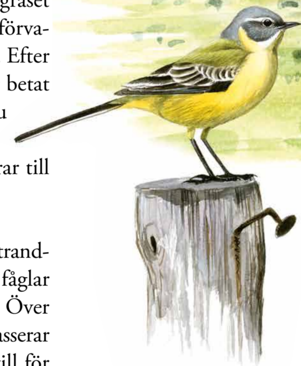
Gulärta ( Motacilla flava ) är en insektsätare som trivs i öppna landskap och ofta häckar nära vatten. Gulärten placerar sitt bo på marken, väl dolt i vegetationen.