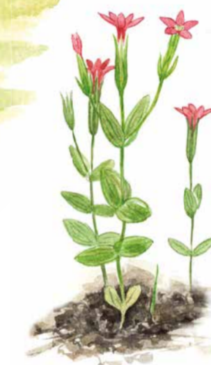
Dvärgarun ( Centaurium pulchellum ) är en liten späd växt som inte blir högre än 10 cm. Den växer ofta nära vatten och blommar från juli till september med små rosa blommor.

Marsviken-Marsäng is included in Natura 2000, the European Union's network of natural areas that are especially worthy of protection.