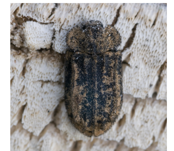
Skrovlig flatbagge är en av många insekter som behöver branden som skapar bra livsmiljöer i döda träd.