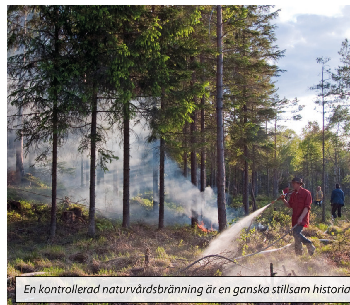
En kontrollerad naturvårdsbränning är en ganska stillsam historia