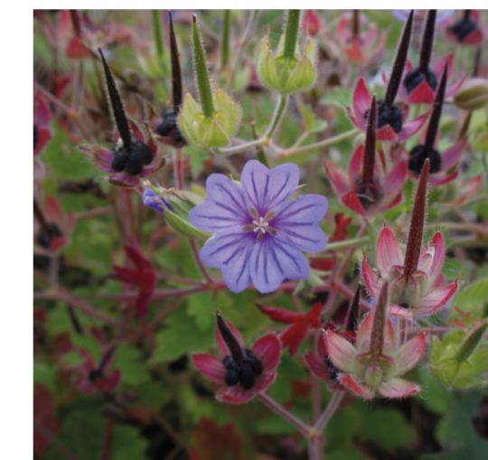
Svedjenävan kan vila i hundra år som frö i marken. När det brinner kan den gro och växa igen.

En lång rad arter är anpassade till brand. För 150 år sedan brann i genomsnitt cirka 1 procent av skogsarealen i Sverige årligen. Idag brinner endast cirka 0,016 procent av skogen - en stor ekologisk förändring på kort tid. Om det brinner för sällan förändras skogarna och flera arter som är beroende av brand, brända träd och gamla tallar får svårt att överleva. Målet med vår bränning i Nynäs är att få en mer ljus och öppen skog, där lövträd och gamla tallar gynnas. Döda träd kommer att lämnas kvar till glädje för många insekter och fåglar.