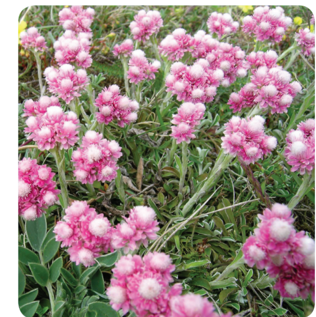
Fuktiga strandängar är populära tillhåll för många fåglar, så som tofsvipan. På sikt får vi en finare flora och fauna på de restaurerade strandängarna och i skogsbetena. Förhoppningsvis kommer kattfoten att öka igen. Den växer på torrare mark.