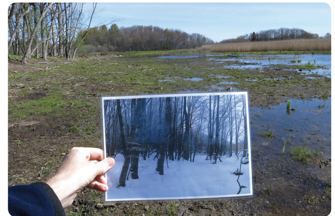
Exempel på hur det kan se ut efter att en alskog återskapats till strandäng. På våren blir den blöta marken ett tillhåll för många rastande fåglar, som till exempel tofsvipa och skogssnäppa. Foto från Askholmens naturreservat i Eskilstuna.