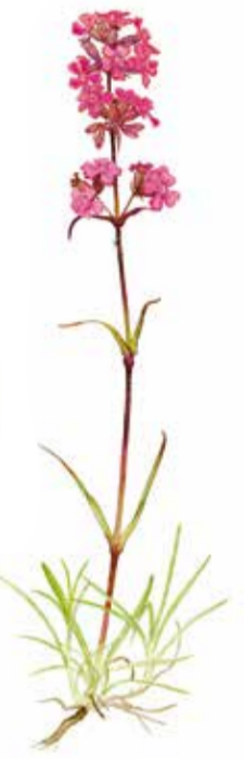
tjärblomster Viscaria vulgaris Bild: N. Forshed