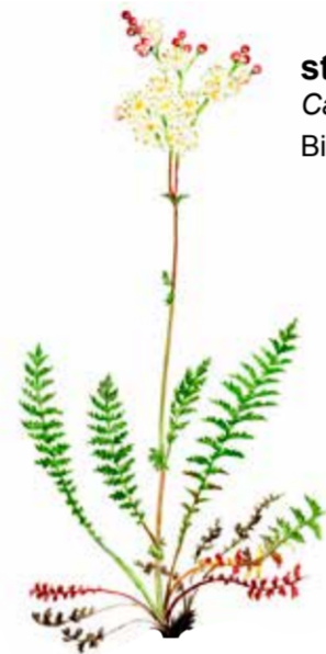
brudbröd Filipendula vulgaris