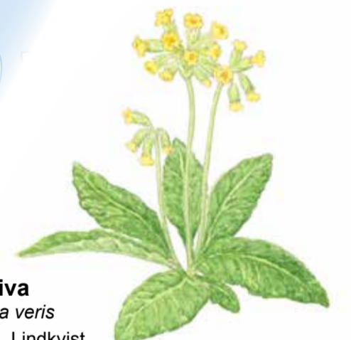
gullviva Primula veris