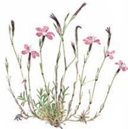
backnejlika Dianthus deltooides

Slätterängen är en av våra mest artrika naturtyper. Ängarna på Örö har hävdats på traditionellt vis ända fram till våra dagar.