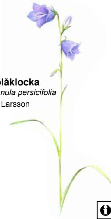
stor blåklocka Campanula persicifolia