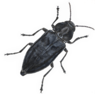
Sotsvart praktbagge, Melanophila acuminata , är en skalbagge som är beroende av skogsbränder för sin överlevnad.