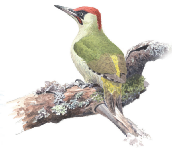
Gröngöling, Picus viridis , är en art som gynnas av skogs- och betesmarker. Har man tur ser man den vackert gröna hackspetten flyga mellan trädstammarna. Desto vanligare är att man hör det skrattande lätet, kly-kly-kly, som accelererar och faller lite i tonhöjd mot slutet.