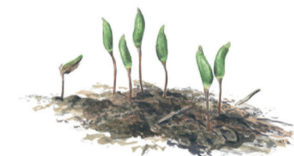
Grön sköldmossa, Buxbaumia viridis , växer på gamla stubbar och grova döda träd.