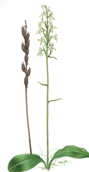
Nattviol, Platanthera bifolia , har väldoftande blommor som doftar särskilt starkt på kvällen och natten. Då lockar den till sig nattfjärilar och särskilt svärmare som pollinerar blommorna.