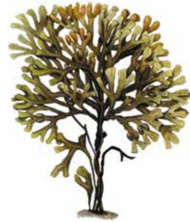
blåstång Fucus vesiculosus