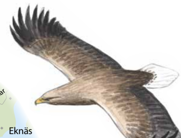
havsörn Haliaeetus albicilla