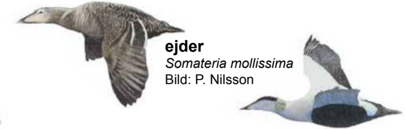
ejder Somateria mollissima