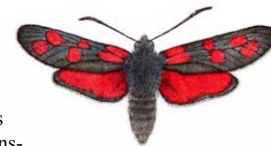
sexfläckig bastardsvärmare Zygaena filipendulae

I de blomsterrika markerna trivs många olika fjärilar som hagtorsfjäril, silverblåvinge och sexfläckig bastardsvärmare