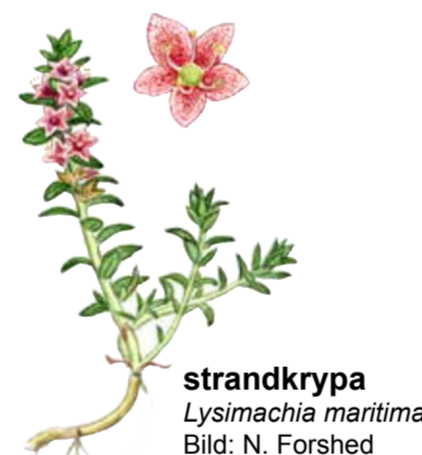
strandkrypa Lysimachia maritima

På reservatets välbetade strandängar växer många lågvuxna örter som till exempel strandkrypa och gulkämpar.