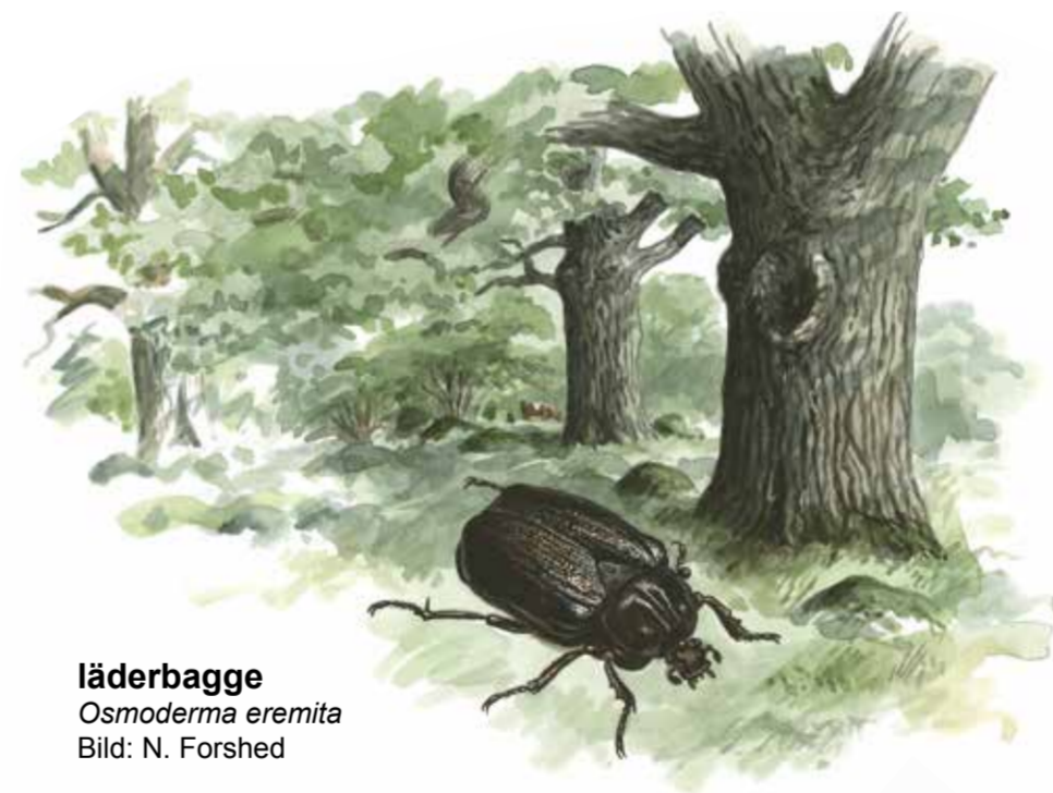
läderbagge Osmoderma eremita Bild: N. Forshed

Doftar det läder vid en trädstam har du funnit läderbaggens hem! Under soliga sensommardagar kan man med lite tur se denna stora skalbagge krypa runt på trädstammen. Läderbaggens larver lever i mulmen inne i ihåliga trädstammar där den livnär sig på den murkna veden. Larvens spillning är upp till 8 mm lång och har en mycket karaktäristisk form som liknar pellets.