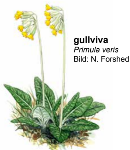
gullviva Primula veris

På reservatets välbetade strandängar växer många lågvuxna örter som till exempel strandkrypa och gulkämpar.