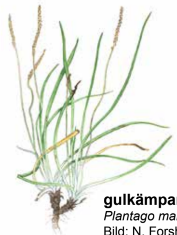
gulkämpar Plantago maritima

Brun kärrhök glidflyger över vasshavet med högt ställda vingar, på jakt efter smådjur. Fågeln till vänster är en hane, den till höger är en hona.