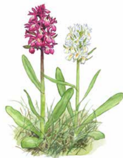
Adam och Eva Dactylorhiza sambucina