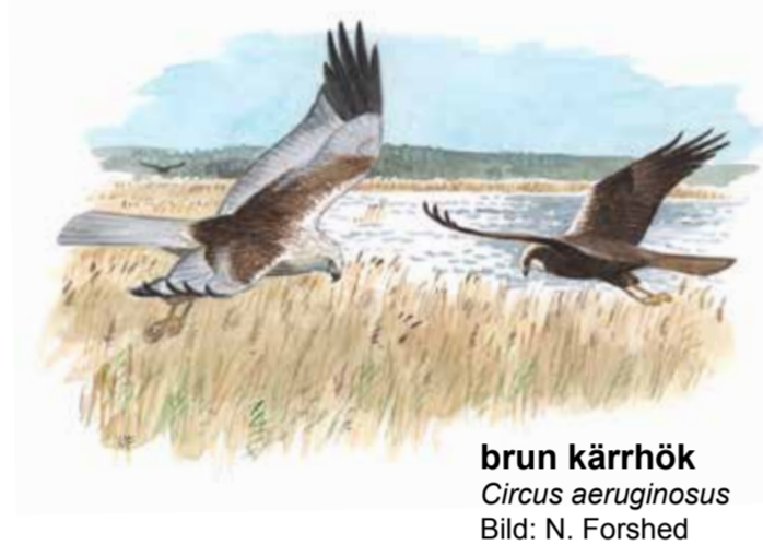
brun kärrhök Circus aeruginosus

I reservatets ekhagar finns många gamla, ihåliga träd med skrovlig bark. Träden är hem för en lång rad sällsynta lavar och skalbaggar. Till områdets rariteter hör läderbaggen, en akut hotad skalbagge som lever i trädens håligheter. Även träd som dött är värdefulla för många organismer som till exempel tickor.