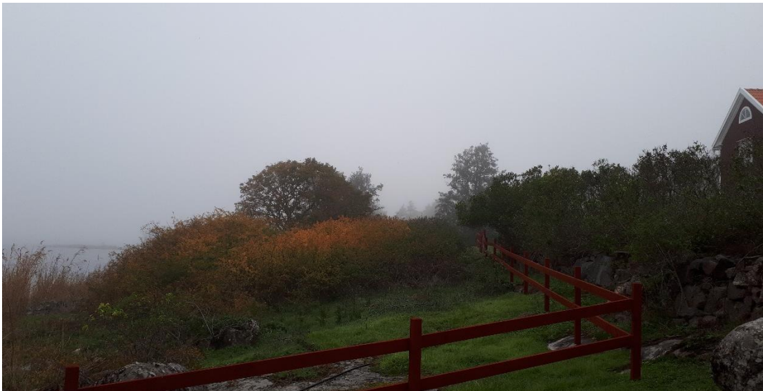
Före åtgärd (okt 2018).