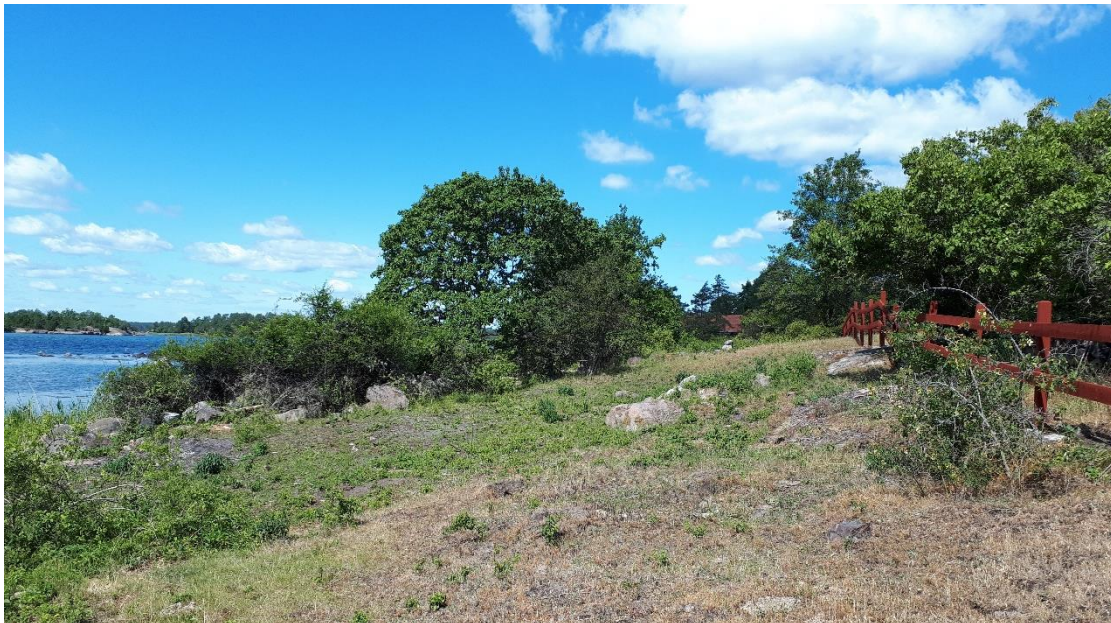
Efter åtgärd (juni 2019). Den nyrestaurerade betesmarken i anslutning till byn har röjts från sly och buskage som tagit över under en period utan hävd. Friställning av vidkroniga träd och skapande av varma bryn var målet med åtgärden, samt att synliggöra stranden och vattnet ifrån husen på nytt.