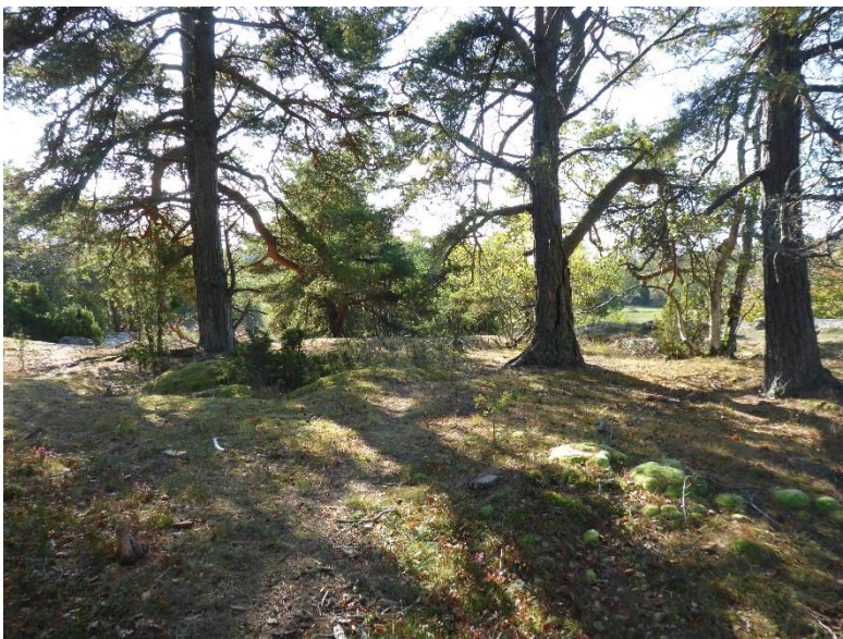
Många gamla tallar har friställts vid åtgärden.