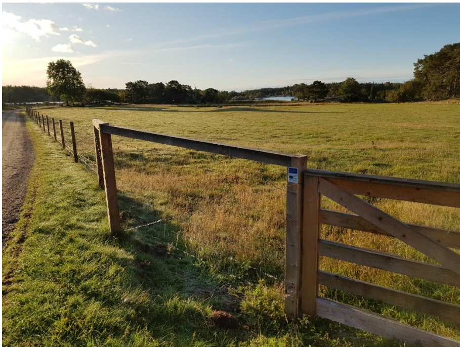
Nytt fårstängsel och en ny grind söder om vägen mot naturum Stendörren.

Inom Stendörrens naturreservat har två gamla fårstängsel bytts ut mot nya fårstängsel för att fungera bättre för betesdjuren.