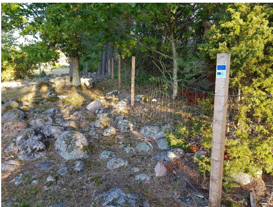
Nytt fårstängsel norr om vägen till naturum Stendörren.