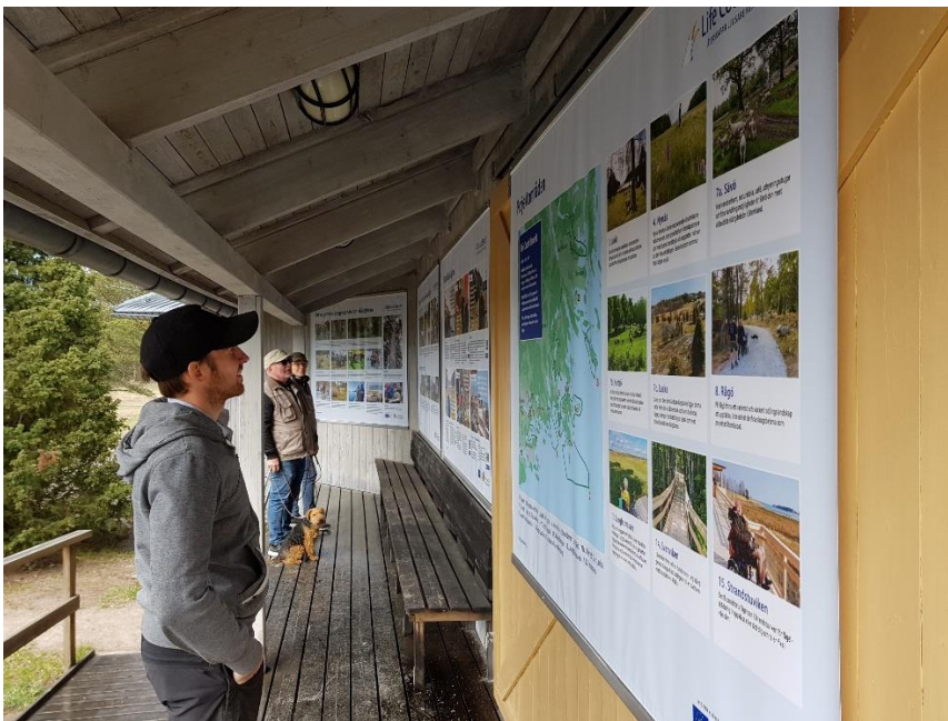
De färdiga veporna monterade på ytterväggen på naturum Stendörren. Eftersom naturum inte är öppet hela tiden och under hela året är det bra att ha en utomhusutställning som är tillgänglig året runt. Utställningen har varit mycket uppskattad hos besökarna.