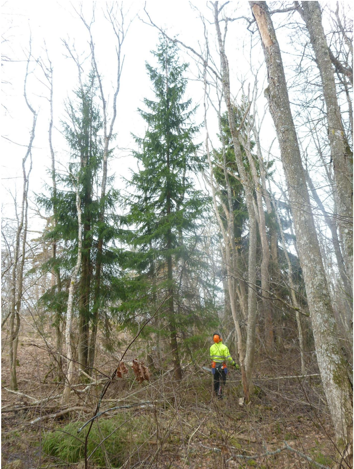
Manuell fällning av gran för att gynna lövet och få in mer ljus på marken.