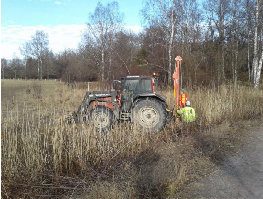
Nedslagning av stängselstolp med stolpnedslagare.