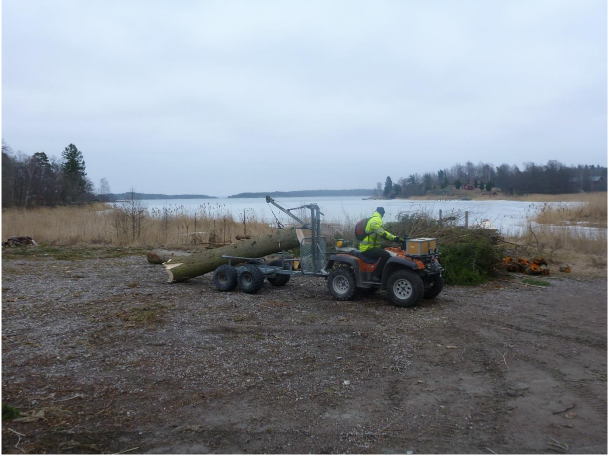
Utkörning av virke och ris med hjälp av fyrhjuling.