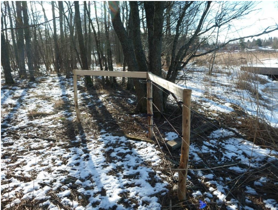
Fyrtrådigt elstängsel med stängselstolp av Robinia uppsatt av MIIM (ramavtal).