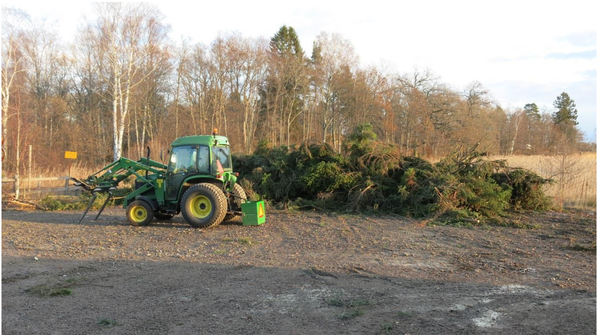
Upplag av ris efter gransanering.