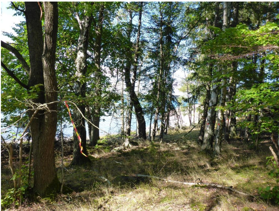
C1 Urglesning i trädsnittet planeras på Hässelöns hävdpräglade delar. Augusti 2016. (C1_Ängelholm_urglesning i björkdominerad miljö_MLn.JPG)