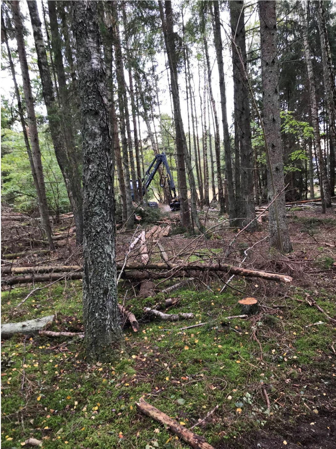
C1 Trädsiktet glesas ur på Hässelöns hävdpräglade delar. December 2018. (C1_maskinhuggning Hässelö_ASn 6.JPG)