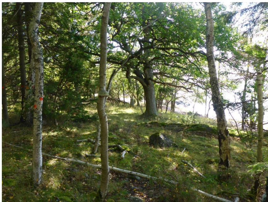
C1 Gläntor ska förstärkas och hävden intensifieras. Hässelön augusti 2016. (C1_Ängelholm_glänta vid ek före åtgärd_MLn.JPG)