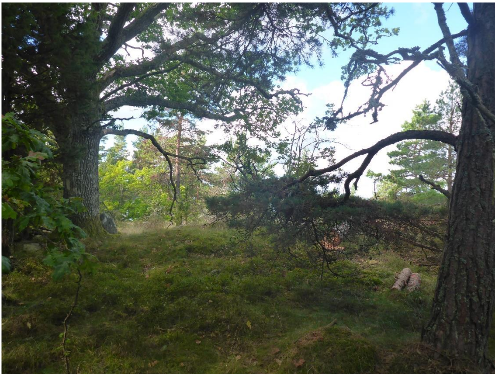
Efter: Samma område efter röjning i september 2016 men fotograferad från motsatt håll. (C1_Ängelholm_Edholmen_mindre konkurrens_MLn.JPG)