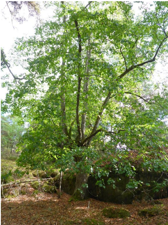
C2 Gammal hamlad lind. Trässholmen september 2016. (C2_Ängelholm_Trässholm_äldra hamlad lind_MLn.JPG)