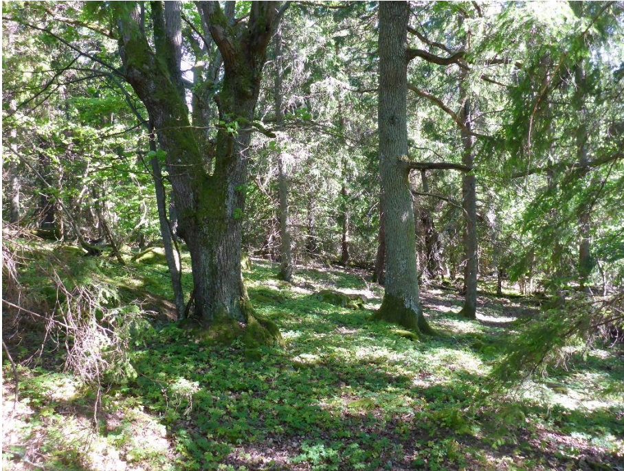
C1 Ung och medelålders gran som hotar lindar och andra naturvärden ska huggas för att släppa in mer ljus i den betade skogen. Hässelön juni 2015. (C1_Ängelholm_gran hotar andra värden_MLn.JPG)