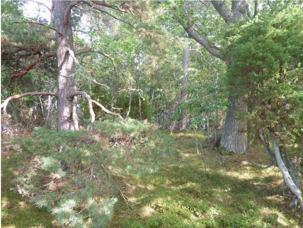
Före: På många ställen finns naturvårdsträd, främst ek och tall, som trängs av yngre träd och buskar. Edholmen Augusti 2016. (C1_Ängelholm_Edholmen_trängda träd_MLn.JPG)