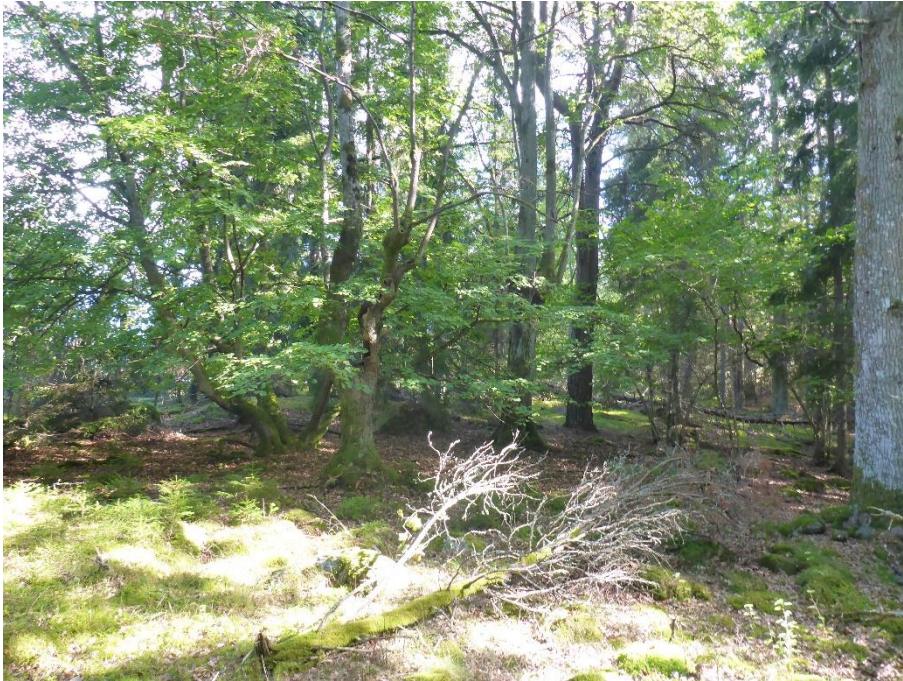
C2 Gamla lindar med tydliga spår av äldre hamling skall återhamlas eller kronreduceras för att få långsiktig överlevnad. Hässelön september 2016. (C2_Ängelholm_Lindar och ekar_MLn.JPG)