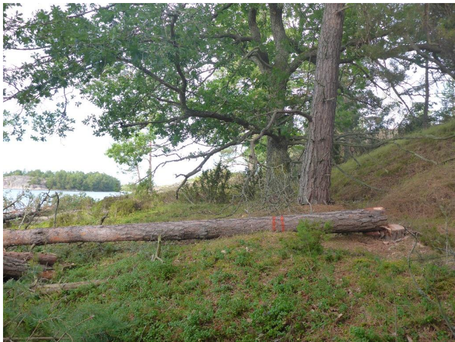
C1 Naturvårdsträd lyfts fram och död ved skapas. Trässholmen augusti 2016. (C1_Ängelholm_Trässholm_naturvårdsträd_MLn.JPG)