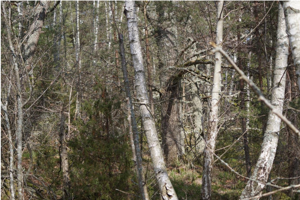
C7 Ek i behov av frihuggning, Kallhamn. (C7_Bråviken yttre_åtgärd akut Kallhamn_MBn.JPG)