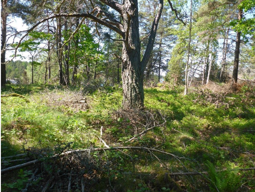
C1 Skogen på Isö har rester från tidigare hävd. Den gamla tallen har röjts fram. (C1_Bråviken yttre_friställd tall Isö_MLn.JPG)