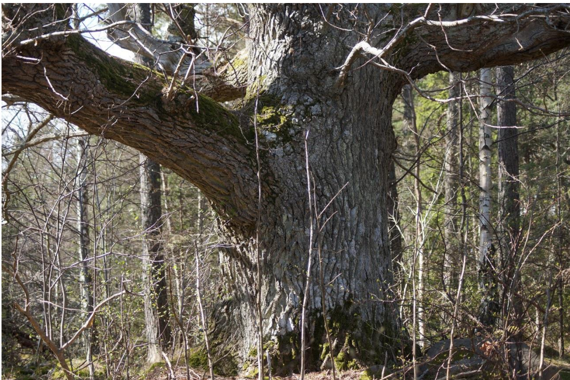
C7 Ek i behov av frihuggning, Kallhamn. (C7_Bråviken yttre_slyt tränger sig på Kallhamn_MBn.JPG)