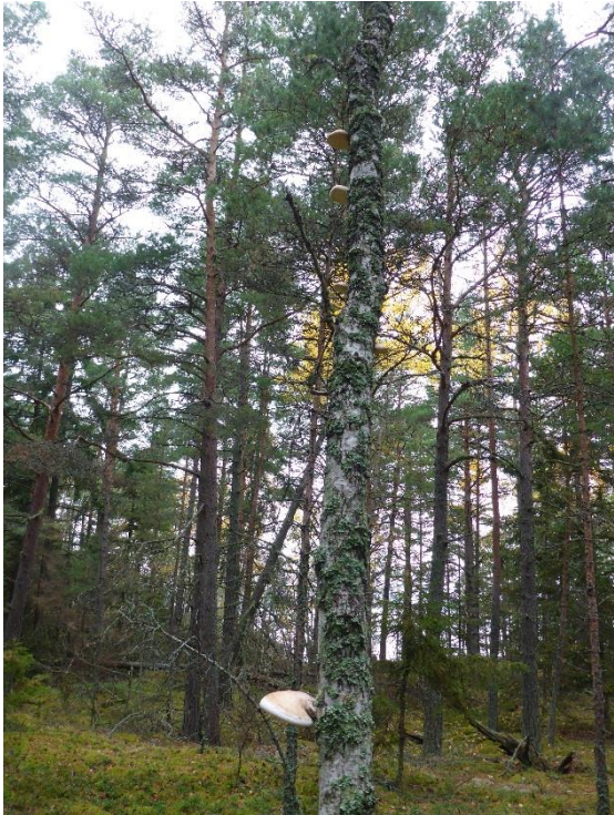
C6 Genom naturvårdsbränning ska ökad variation och mer död ved skapas på Kuggholmen. (C6_Bråviken yttre_Lövinslag Kuggholmen_MLn.JPG)