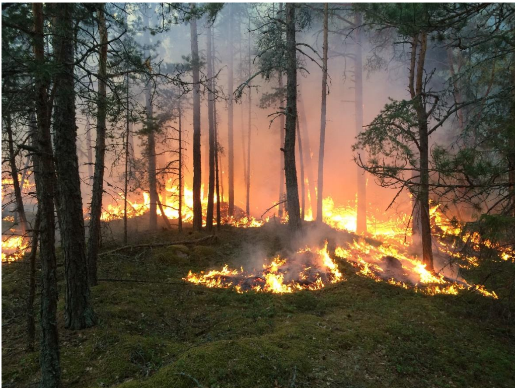
C6 Branden hade varierande intensitet. (C6_Bråviken yttre_hög intensitet i branden_MMr.JPG)