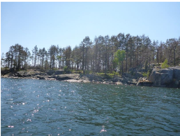
C6 Två år efter insatsen ser man på håll att skogen är gles och innehåller många döda träd. (C6_Bråviken yttre_Kuggholmen två år efter naturvårdsbränning_MLn.JPG)