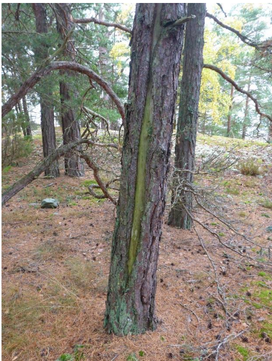
C6 Så kallade brandljud påvisar att det förekommit bränder tidigare. (C6_Bråviken yttre_Brandljud Kuggholmen_MLn.JPG)