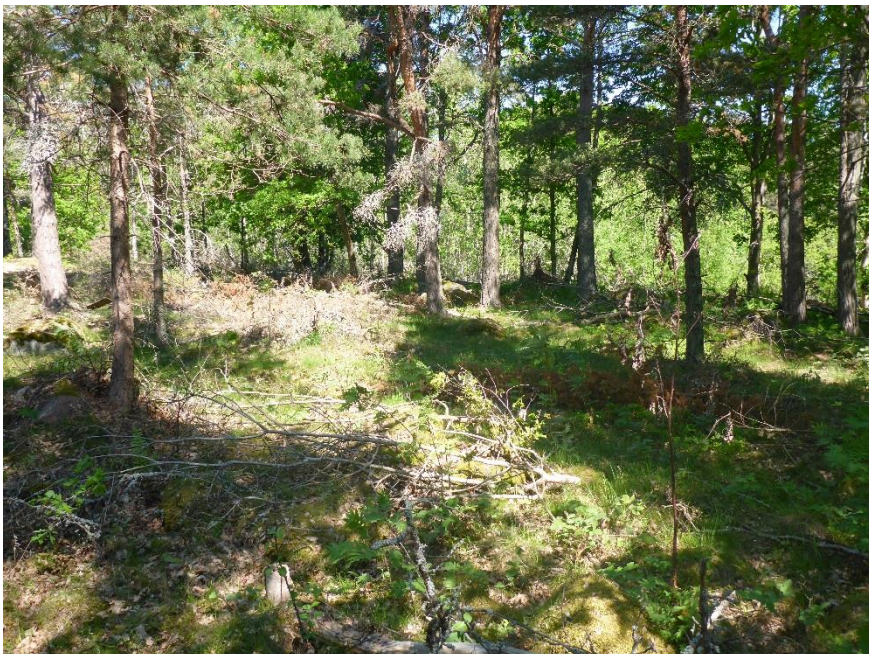
C1 Manuellröjning har genomförts på Isö och får vid behov bli återkommande för att säkerställa en ljusöppnare miljö likt den det var då ön betades. (C1_Bråviken yttre_manuellröjd yta Isö_MLn.JPG)