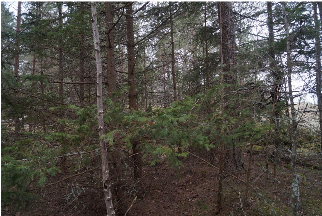
C7 Ungskogen tar över. (C7_Bråviken yttre_ungskogen tar över Kallhamn_MBn.JPG)