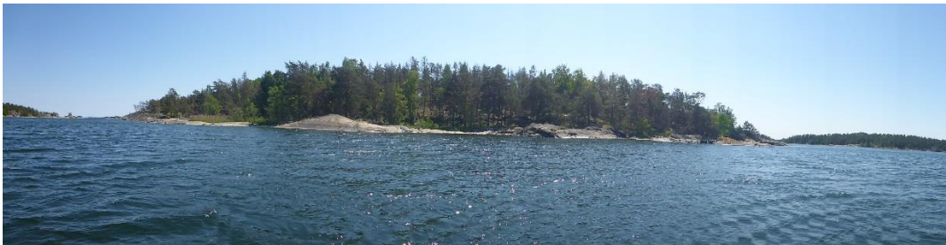
C6 Två år efter insatsen ser man på håll att skogen är gles och innehåller många döda träd. (C6_Bråviken yttre_Kuggholmen två år efter naturvårdsbränning_MLn.JPG)