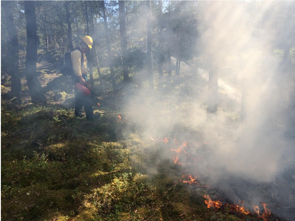
C6 Naturvårdsbränning genomförs i maj 2016. (C6_Bråviken yttre_tänt var det här_MMr.JPG)