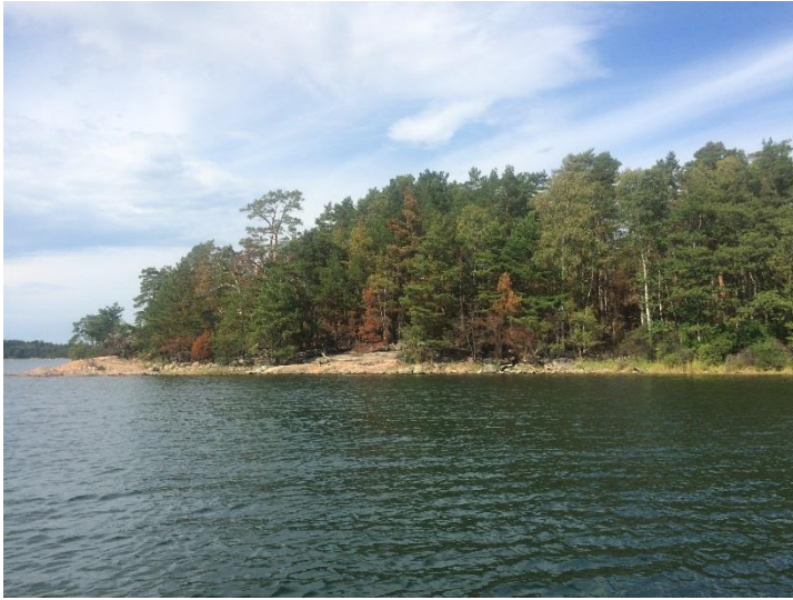
C6 Efter insatsen ser man att skogen är påverkad. (C6_Bråviken yttre_Kuggholmen _efter åtgärd_AFd.JPG)