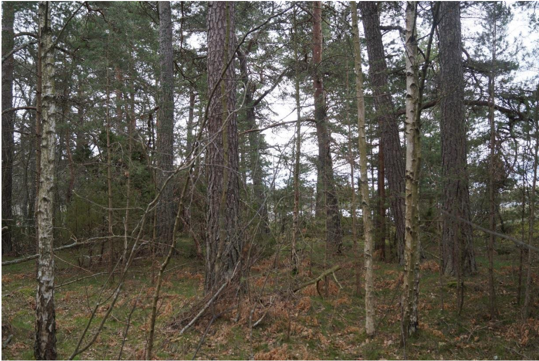
C7 De äldre tallarna är trängda på Kallhamn. (C7_Bråviken yttre_trängda tallar Kallhamn_MBn.JPG)