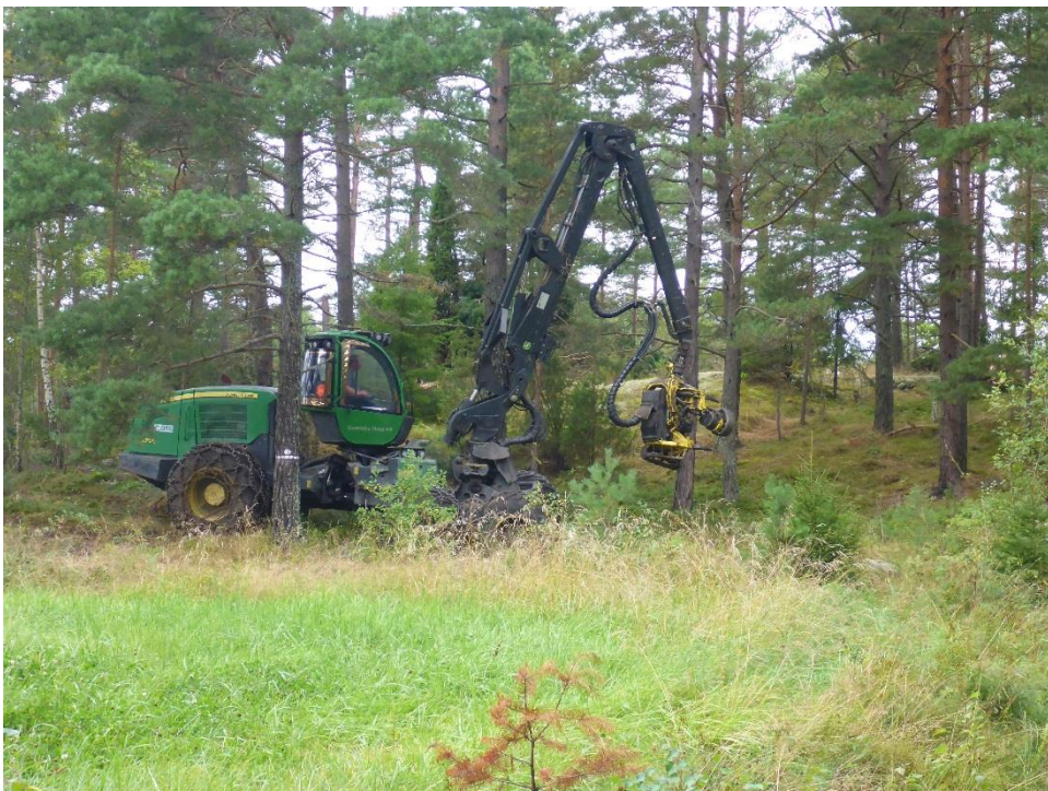
C1 En skördare plockhugger för att skapa gläntor, ökad variation och skapa mer död ved. (C1_Arnö_plockhuggning med skördare_MLn.JPG)