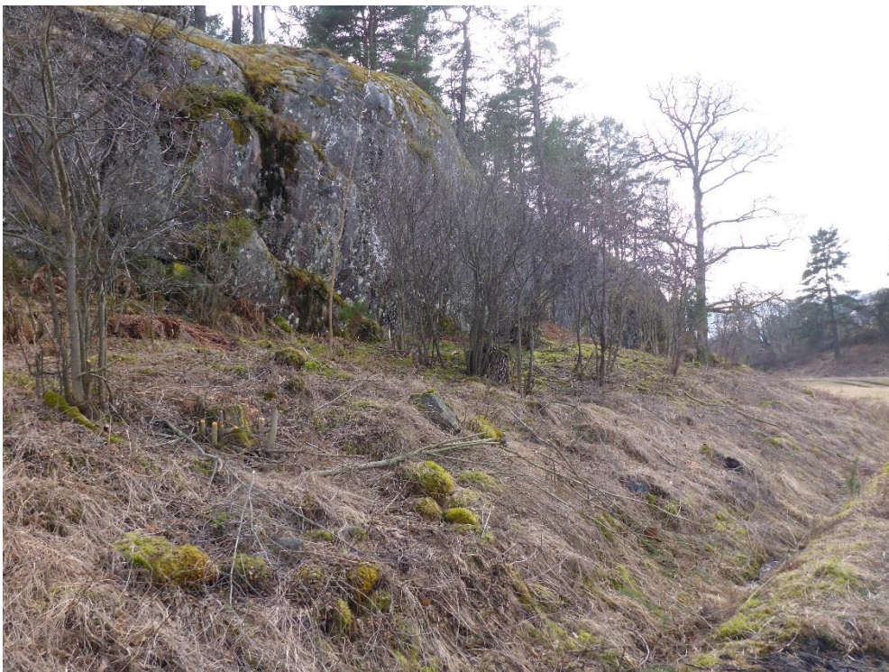
Efter: Samma område i mars 2016. Kantzonen har röjts manuellt, träd och buskar med naturvärde har lyfts fram. (C1_Arnö_brynmiljö har röjts_MLn.JPG)