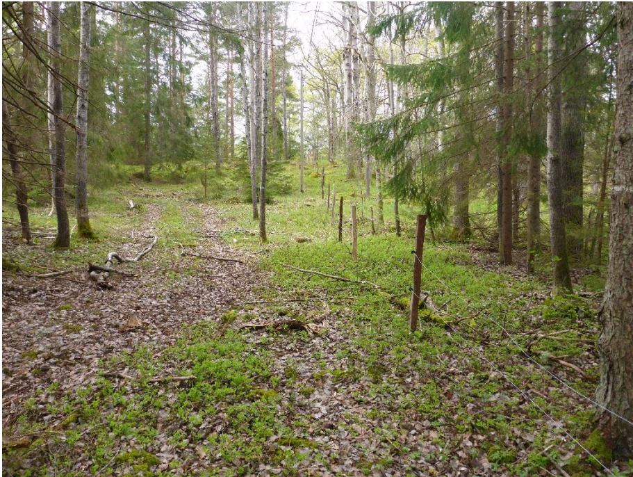
C1 Nya stängsel möjliggör beteshävd igen. (C1_Arnö_nystängsling i lövdominerad betesskog_MLn.JPG)