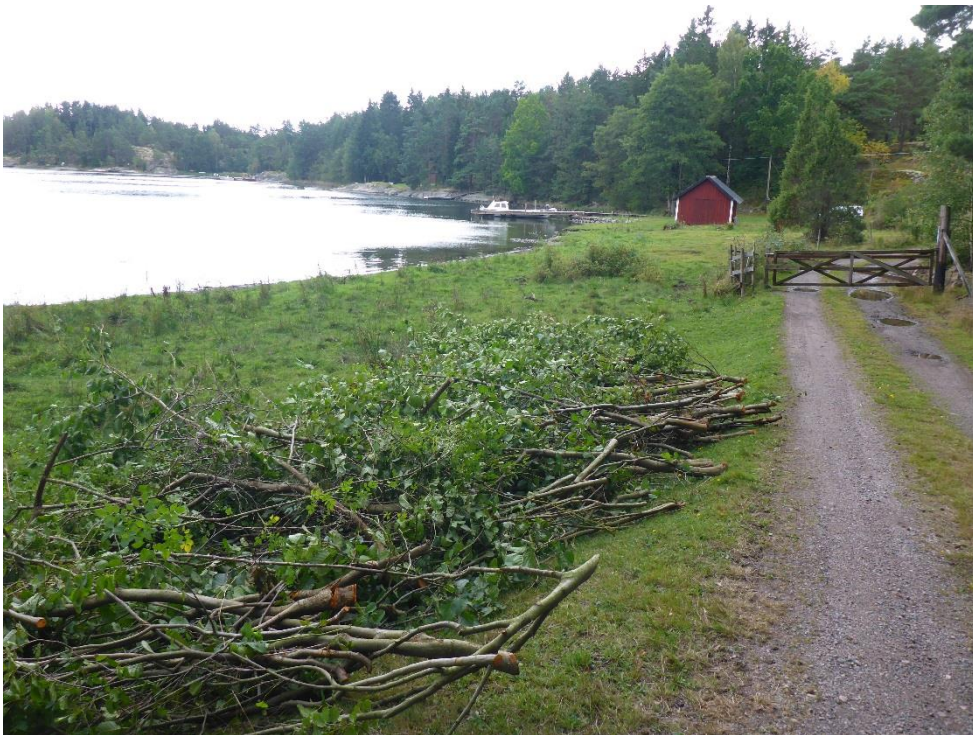
C1 Strandbeten röjs fria från slyuppslag. (C1_Arnö_strandängsmiljöer ska vara fria från al och annan sly_MLn.JPG)