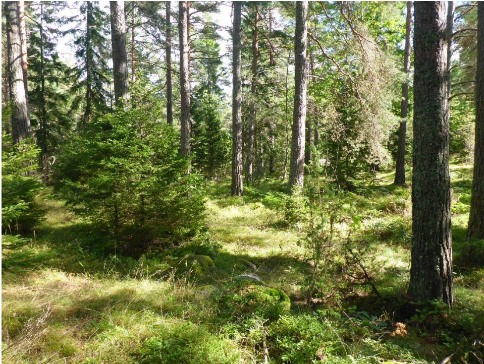
C1 En flerskiktad men inte för tät skog med återupptagen beteshävd är målbilden för stora delar av restaureringsytorna på Arnö. (C1_Arnö_flerskiktad men inte för tät skog är målet_MLn.JPG)