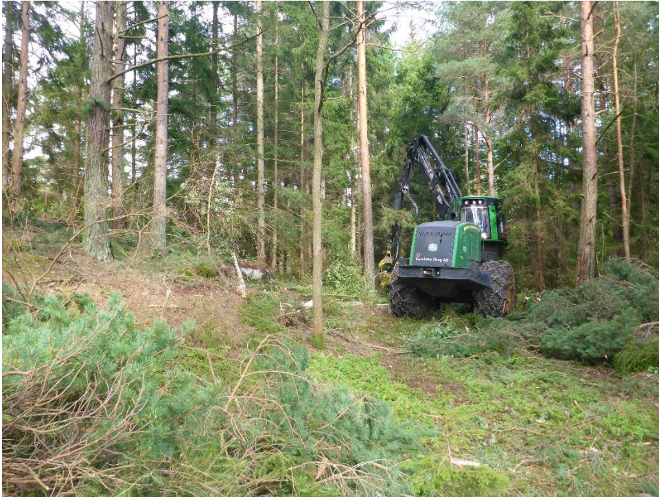
C1 Skördaren arbetar sig in i de igenväxtra tidigare beteshävdade skogarna. (C1_Arnö_skördaren arbetar sig in i de täta fd betade skogarna_MLn.JPG)