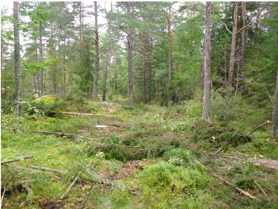
C1 Gläntor skapas och ljus kommer ner i de tidigare beteshävdade skogarna. (C1_Arnö_ljus släpps ner i de tidigare betade skogarna_MLn.JPG)