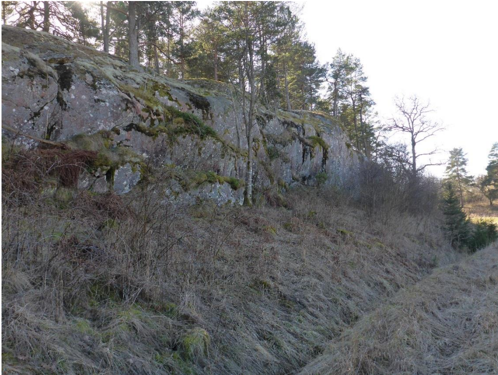
Före: Kantzon mellan berg och åker håller på att växa igen med sly. Mars 2015. (C1_Arnö_igenväxande bryn_MLn.JPG)