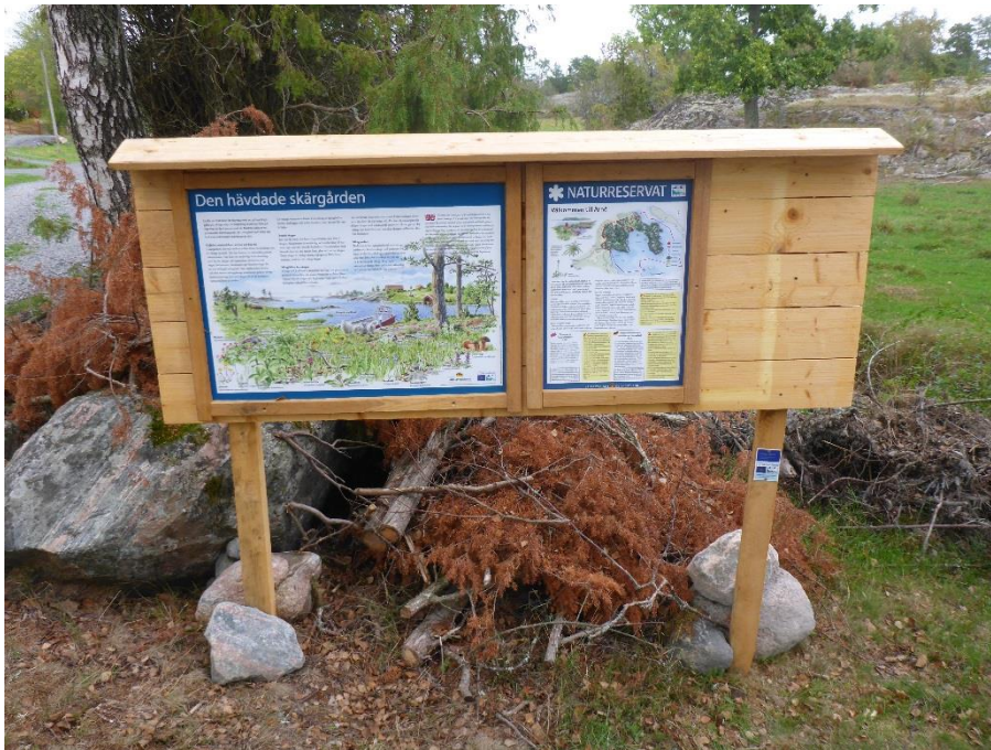
E2 Nytt skyltställ uppsatt inne i reservatet. På skyltstället finns biotopskylt om den hävdade skärgården framtagna i projektet förutom den reservatsskylt som finns sedan tidigare. (E2_Arnö_skytstall2_JRm.JPG)