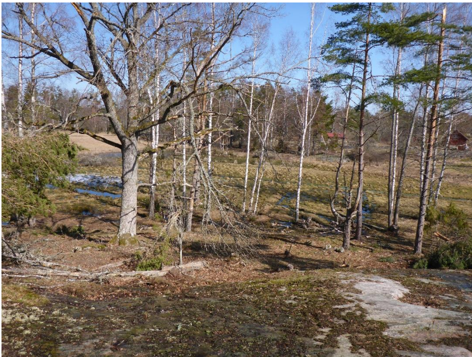
Efter: Samma område i april 2018. Området har hävdats med betesdjur ett par säsonger. (C1_Arnö_restaurerat område nu i hävd_MLn.JPG)