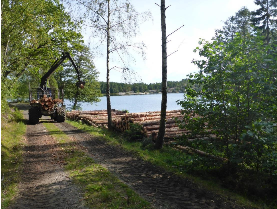
C1 Ljuset från havet når åter in i landskapet. (C1_Arnö_när igenväxningen åtgärdas kommer ljuset in från havet_MLn.JPG)