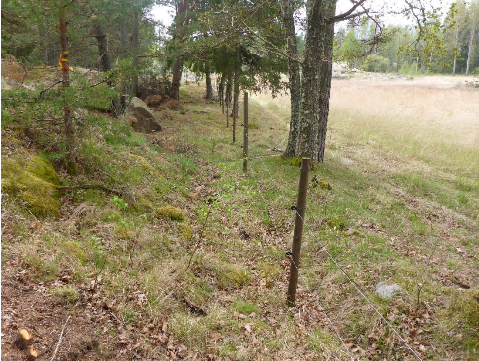
C1 Stängsling möjliggör åter bete i skogen. (C1_Arnö_stängsling möjliggör åter bete i skogen_MLn.JPG)