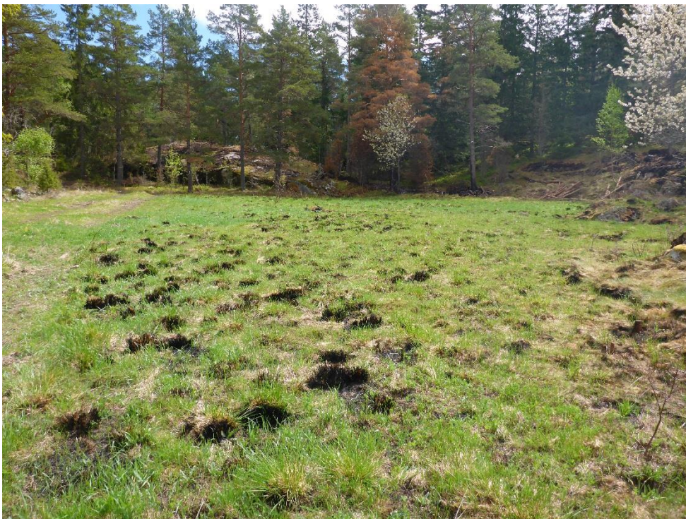
Efter: Samma område men i lite annan bildvinkel, maj 2016. Området har röjts och sedan ofrivilligt bränts, är nu klart för beteshävd. (C1_Arnö_övergiven mark är röjd och ofrivilligt bränd_MLn.JPG)