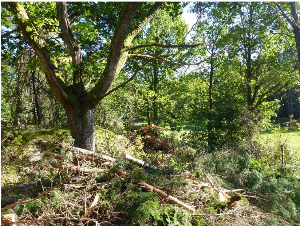
C1 Lövrika kantzoner förstärks. (C1_Arnö_lövrík kantzon gynnas_MLn.JPG)