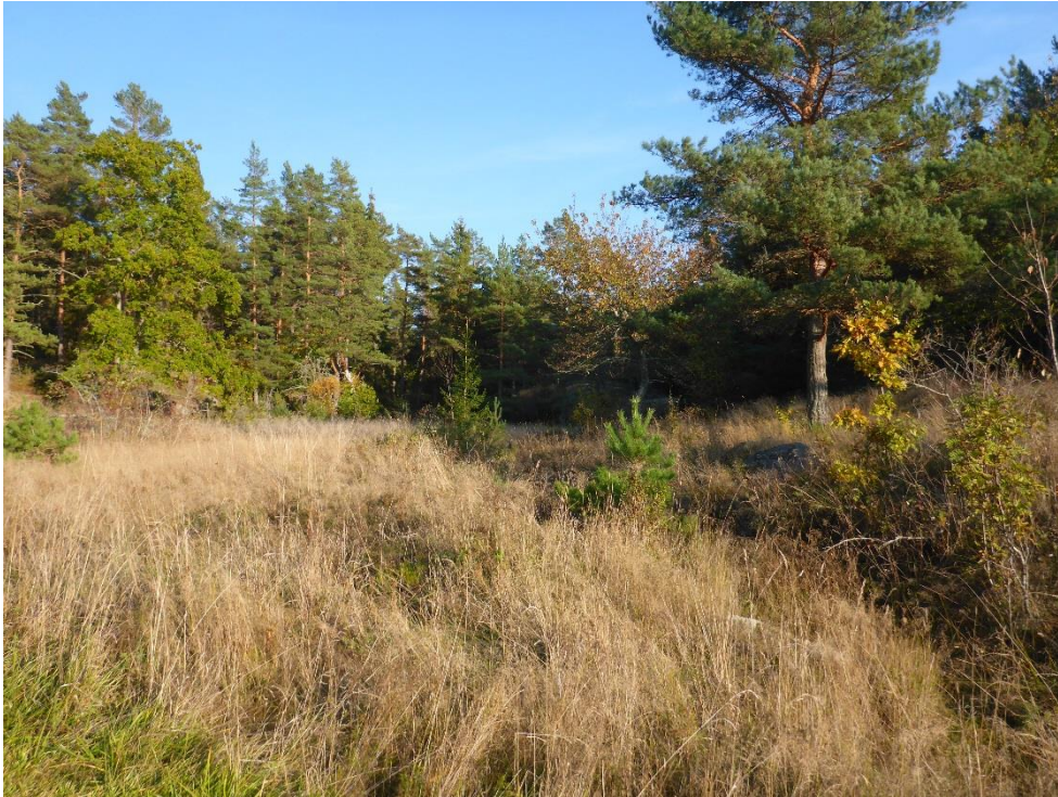
Före: Ohävdad öppen mark ska röjas och åter betas, oktober 2015. (C1_Arnö_övergiven öppen mark skall röjas och åter betas_MLn.JPG)