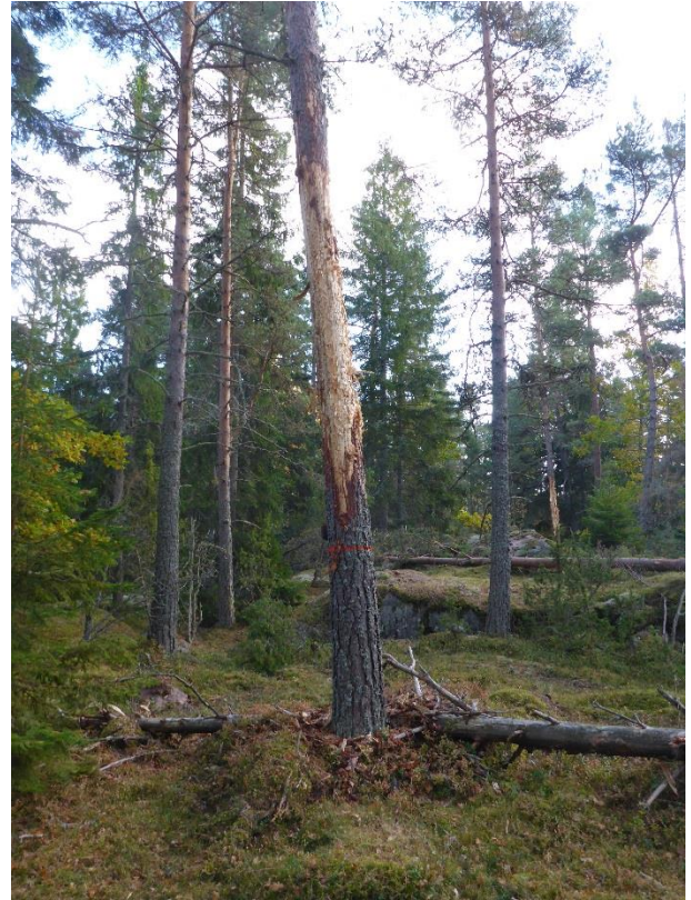
C1 Stående och liggande död ved skapas. (C1_Arnö_stående och liggande död ved skapas_MLn.JPG)