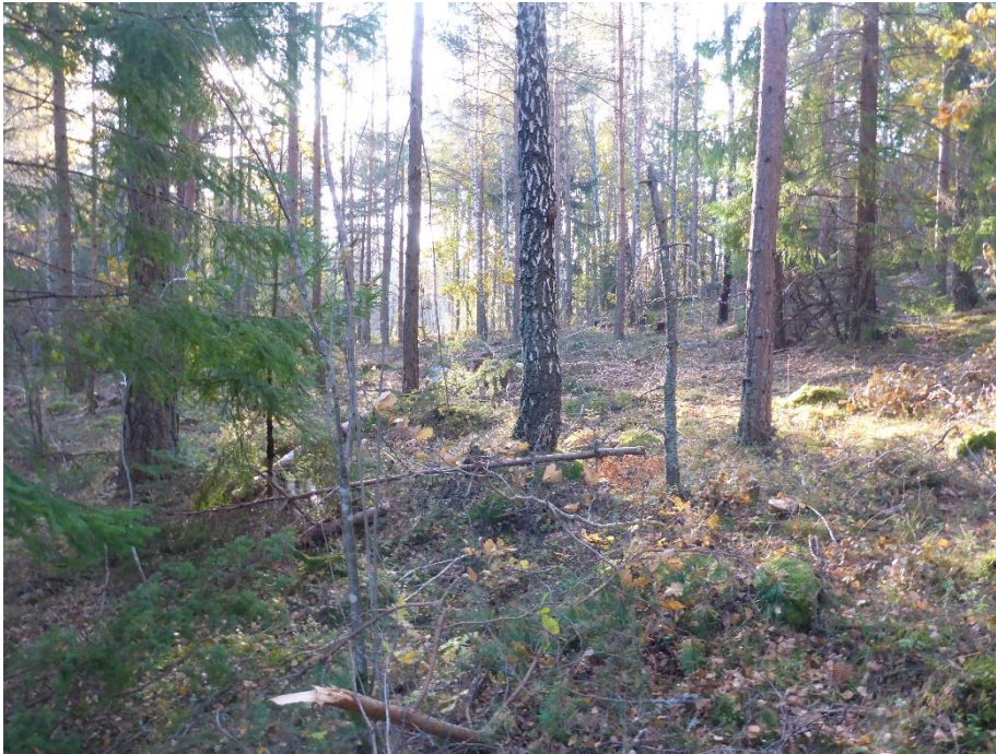
C7 Lövträd gynnas och variationen ökar genom uttag av barrträd från likåldrigt blandskogsbestånd. (C7_Arnö_barrgallring i likåldrigt blandskogsbestånd_MLn.JPG)