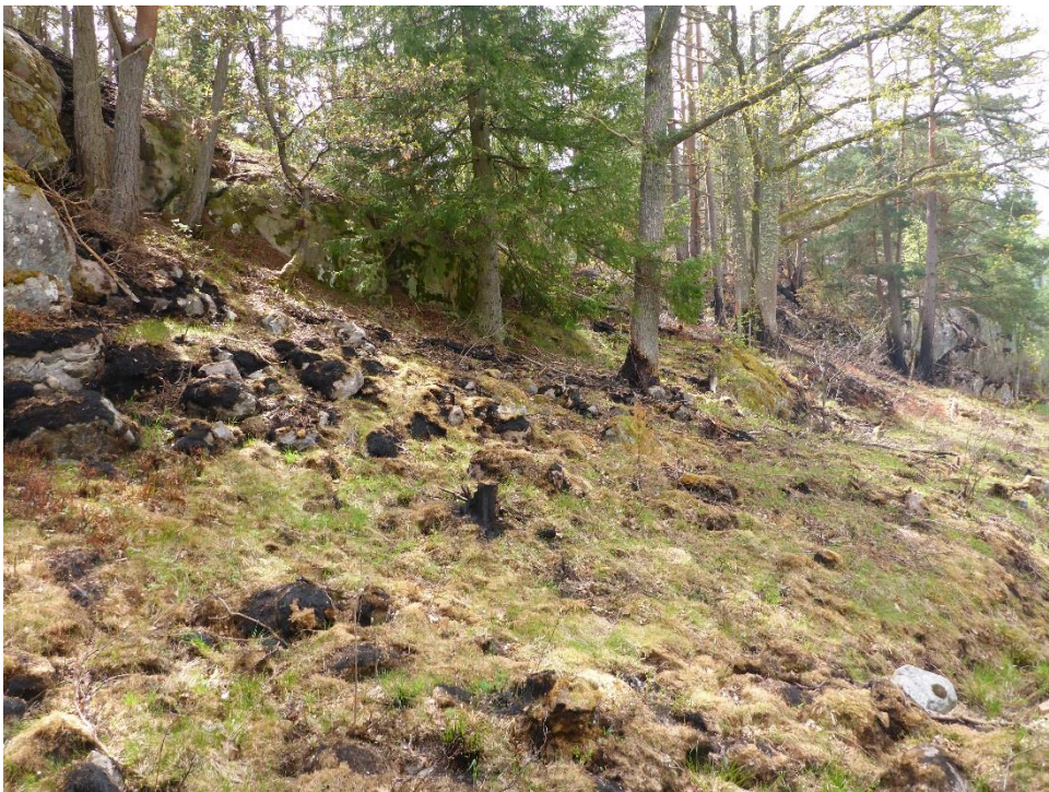
C1 En ofrivillig brand kunde ha ställt till det mer men nu fick delar av området hjälp med röjningen av uppslag och bränd död ved skapades. (C1_Arnö_en ofrivillig brand hjälpte till med röjningen_MLn.JPG)