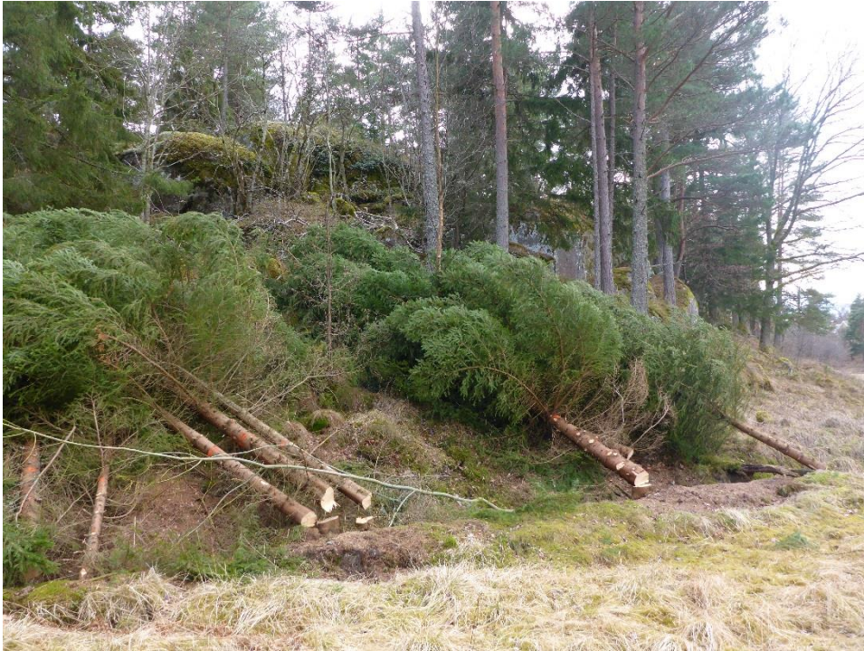
C1 Ung gran röjs från öppna betesmiljöer. (C1_Arnö_gran ska inte ta över i de öppna betena_MLn.JPG)