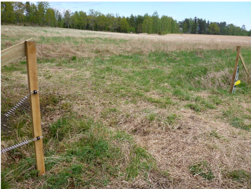
C1 Stängselgenomgång för skötseln av markerna i området. (C1_Arnö_öppning i stängsel för rationell skötsel_MLn.JPG)