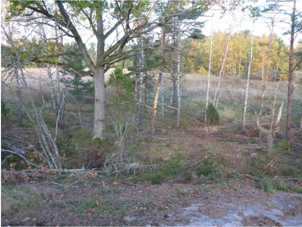
Före: Ohävdad område röjs för bete oktober 2015. (C1_Arnö_ohävdad område röjs för bete_MLn.JPG)