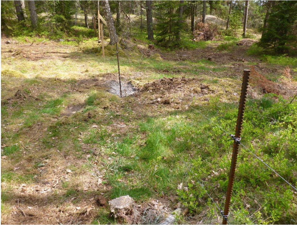
C1 Stängsling i moränmark och andra kustmiljöer kräver ofta bergborrning. (C1_Arnö_stängsling i moränmark kräver ofta bergborrning_MLn.JPG)