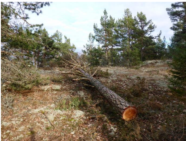
C1 Tallågor skapas både i öppna och i mer skuggiga lägen. (C1_Arnö_tallåga för den lägre faunan_MLn.JPG och C1_Arnö_tallågor skapas även i mer skuggiga lägen_MLn.JPG)