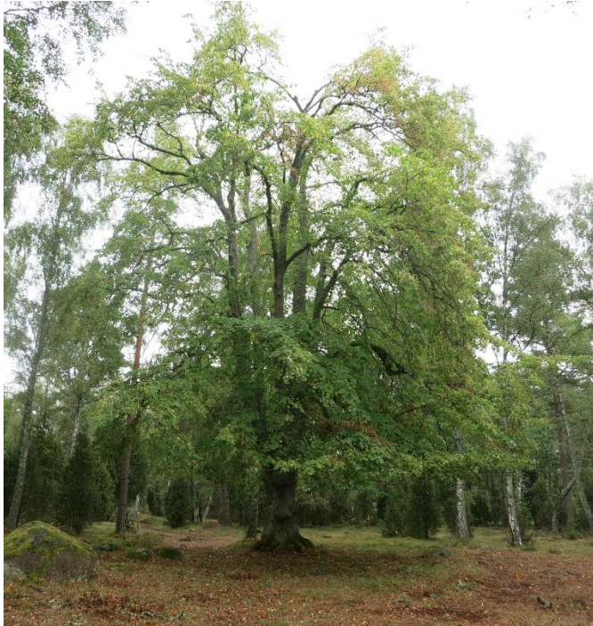
Kronreducering av äldre hamlade lindar. Action C2. Efter åtgärd.