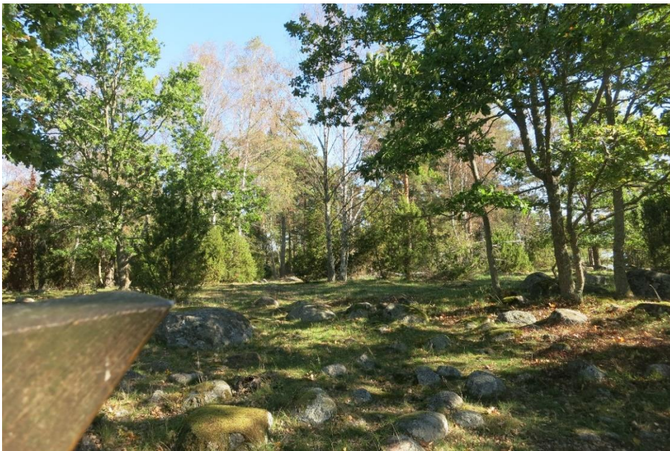
Restaurering av betesmark, SÖ delen. Action C1. Efter åtgärd.