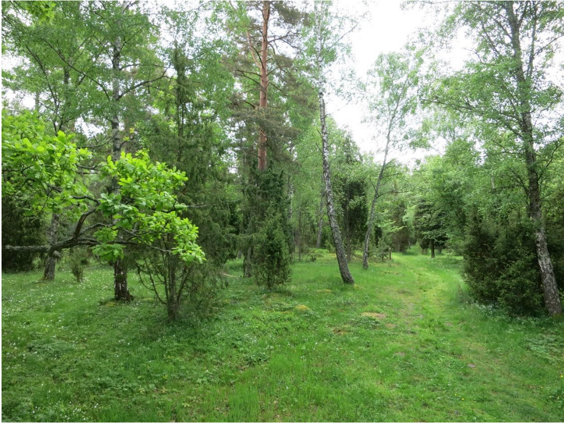
Restaurering av betesmark, SÖ delen. Action C1. Före åtgärd.