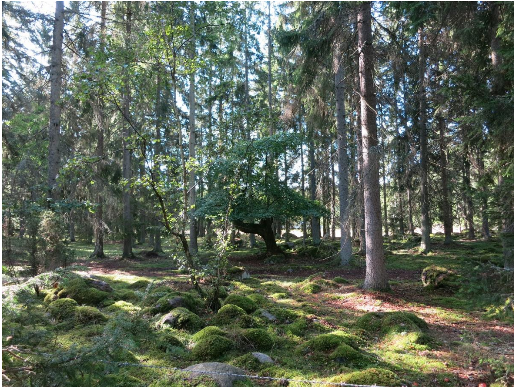
Friställning av äldre hamlad lind och förstärka gläntor i betad skog. Action C1 och C2. Före åtgärd.