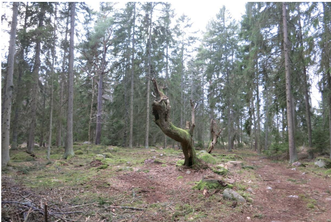
Friställning av äldre hamlad lind och förstärka gläntor i betad skog. Action C1 och C2. Efter åtgärd.