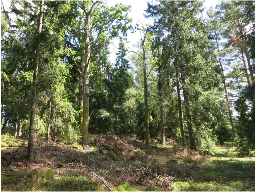
Skogsbete som restaurerats. Action C1. Före åtgärd.