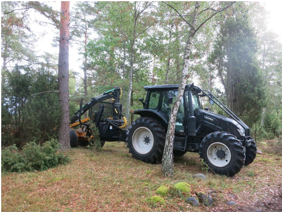
Utkörning av virke och röjningsmaterial med traktor med huggarvagn. Action C1.