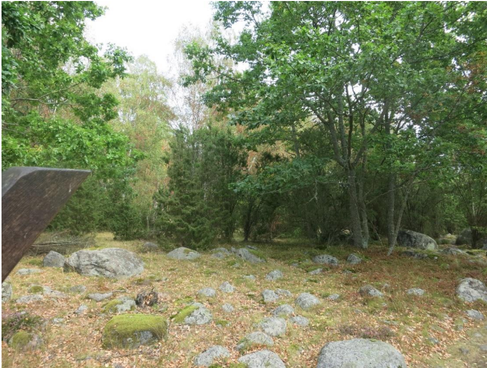
Restaurering av betesmark, SÖ delen. Action C1. Före åtgärd.