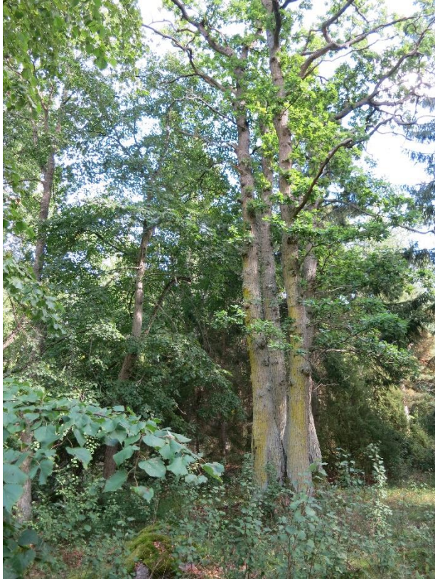
Skogsbete som restaurerats. Action C1. Före åtgärd.