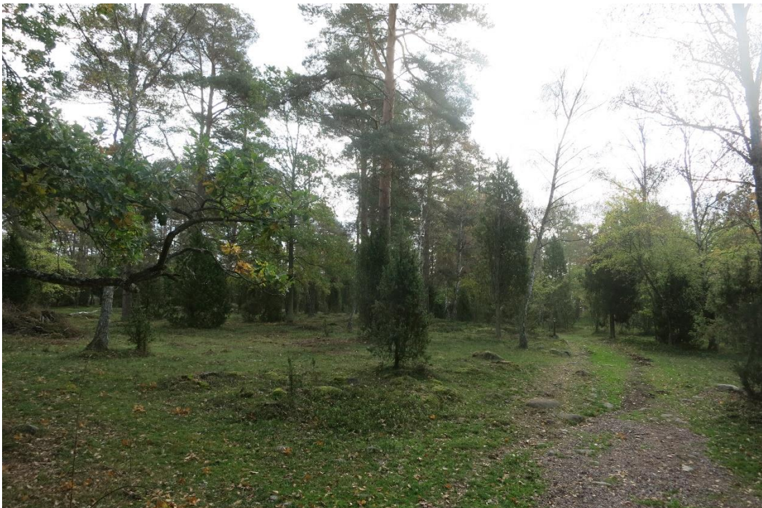
Restaurering av betesmark, SÖ delen. Action C1. Efter åtgärd.