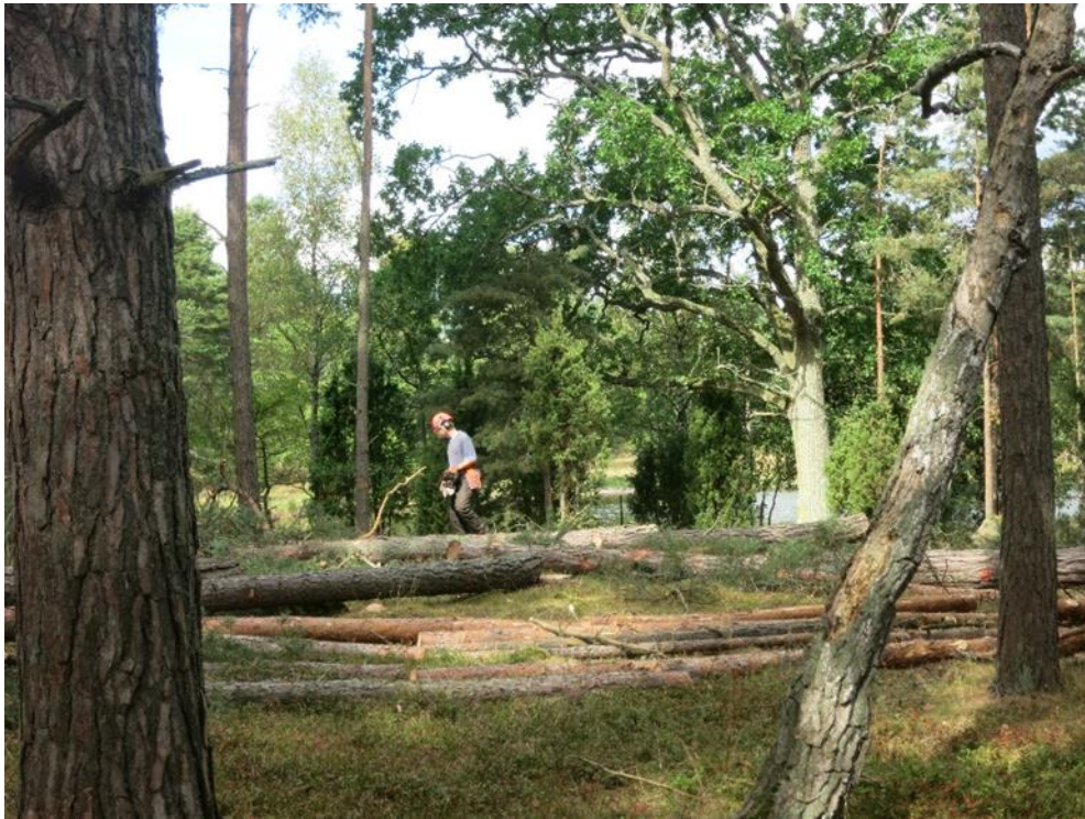
Manuell huggning vid restaureringsinsatserna. Action C1.