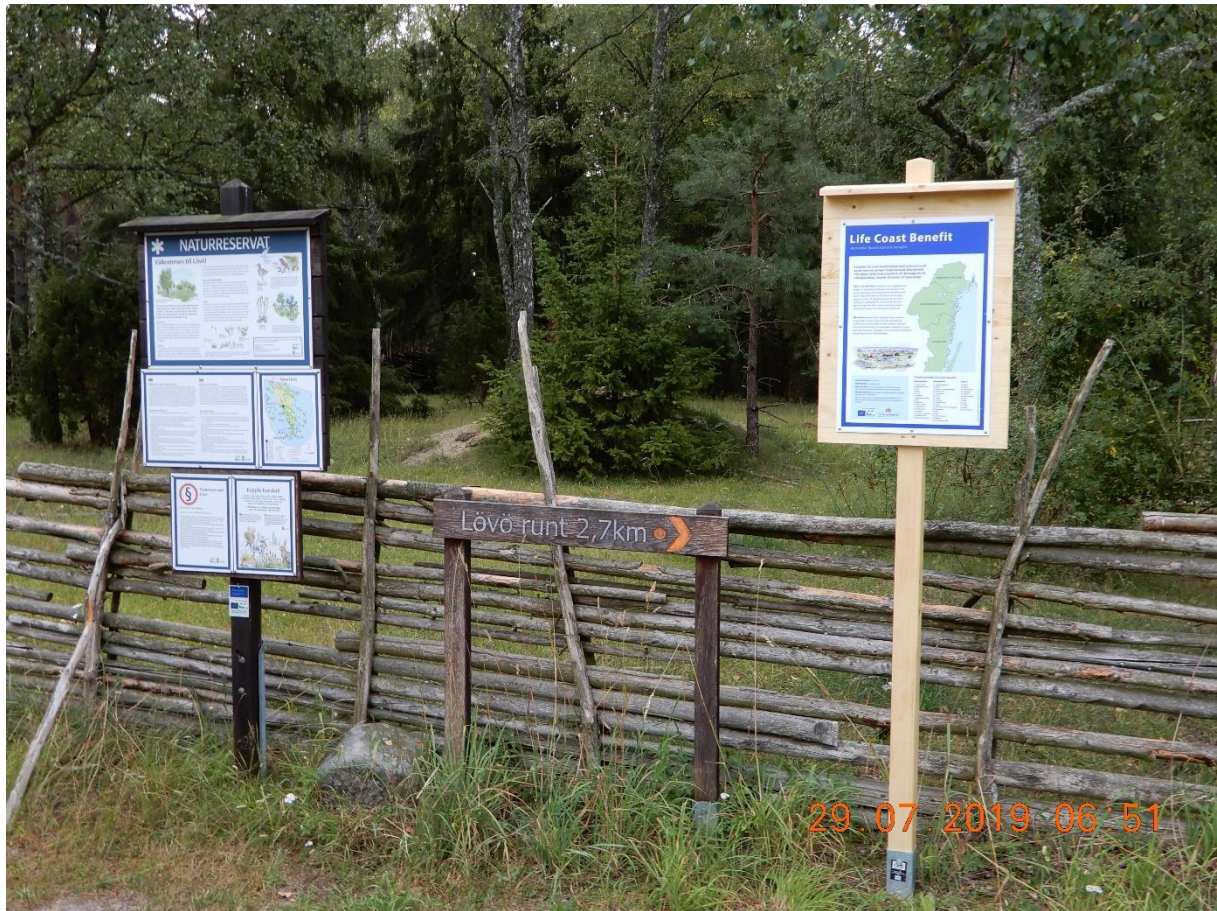
Skyltning på Lövö vid parkering för besökare.