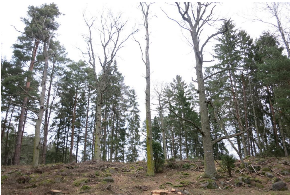
Skogsbete som restaurerats. Action C1. Efter åtgärd.