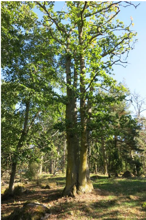
Skogsbete som restaurerats. Action C1. Efter åtgärd.