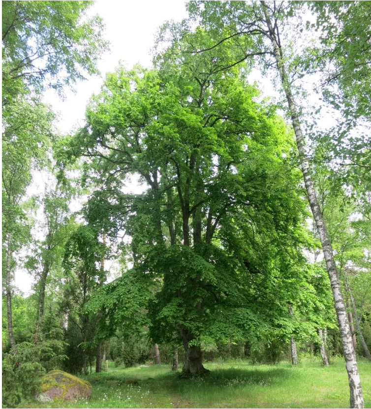
Kronreducering av äldre hamlade lindar. Action C2. Före åtgärd.